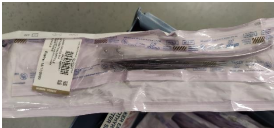
Lame droite 3 et 4