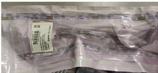
Kit Fastrach 4 + sonde armée