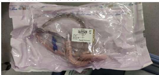
Kit Cricothyrotomie Cook