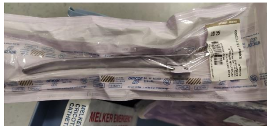
Guide sonde intubation difficile